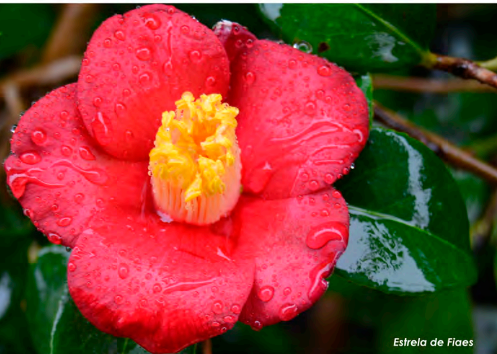
Estrela de Faes