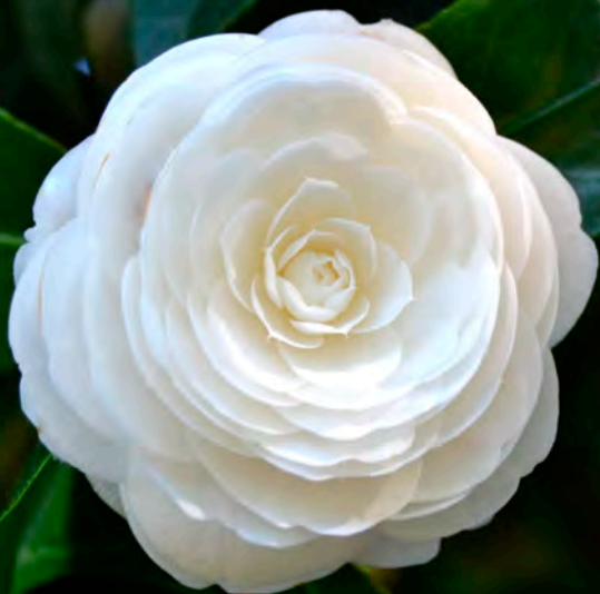
Duchesse de Berry